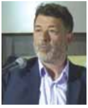
Γράφει ο ΠΕΡΙΚΛΗΣ ΑΜΠΕΡΙΑΔΗΣ

▼ Η Τοπική Αυτοδιοίκηση αποτελεί την σύγχρονη έκφραση της Άμεσης Δημοκρατίας, όπως αυτή επινοήθηκε, θεσμοθετήθηκε και έγινε πράξη με την Πόλη – Κράτος στην εποχή της κλασικής αρχαιότητας στην Αθήνα.